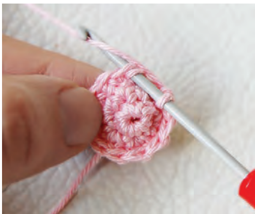
Imagem 6 - Rod 4, diminuição invisível descrita na página 1