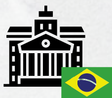
Corretora no Brasil