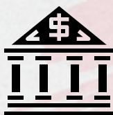
Instituição Financeira - administrador (Banco BNP Paribas)