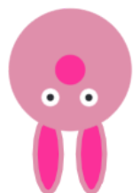
Educação de Montessori