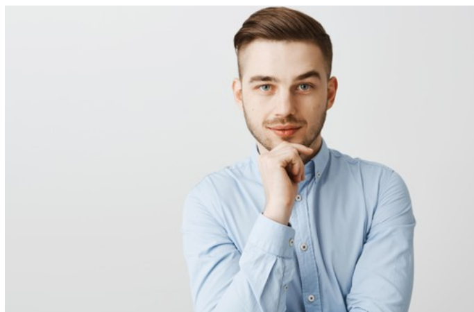
Foto com cara de inteligente. Tirar com 3 camisas diferentes e dois fundos diferentes.