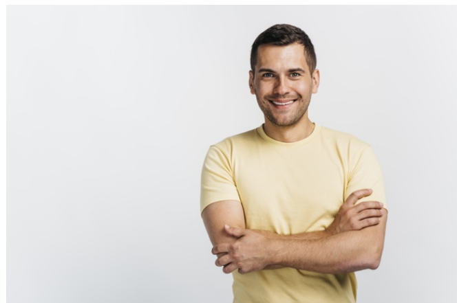
Foto com braços cruzados (sorrindo e sério). Tirar com 3 camisetas diferentes e dois fundos diferentes.