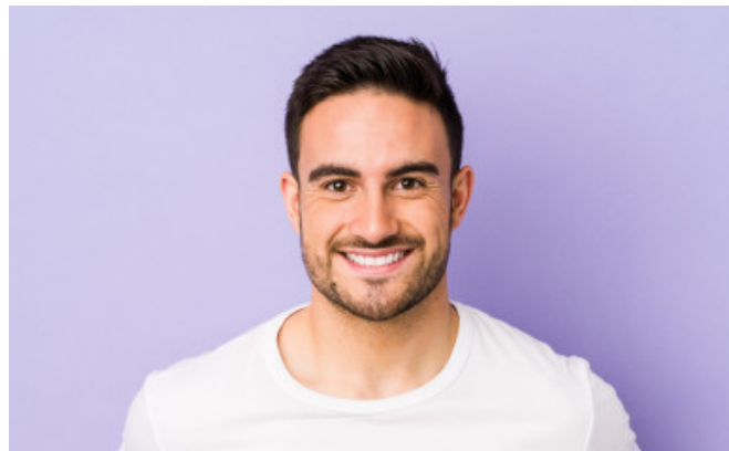
Foto (sorrindo e sério) de frente, do ombro para cima. Tirar com 3 camisetas diferentes e dois fundos diferentes.