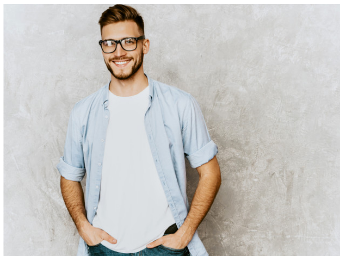
Foto (sorrindo e sério) com a mão no bolso. Tirar com 3 camisas diferentes e dois fundos diferentes.