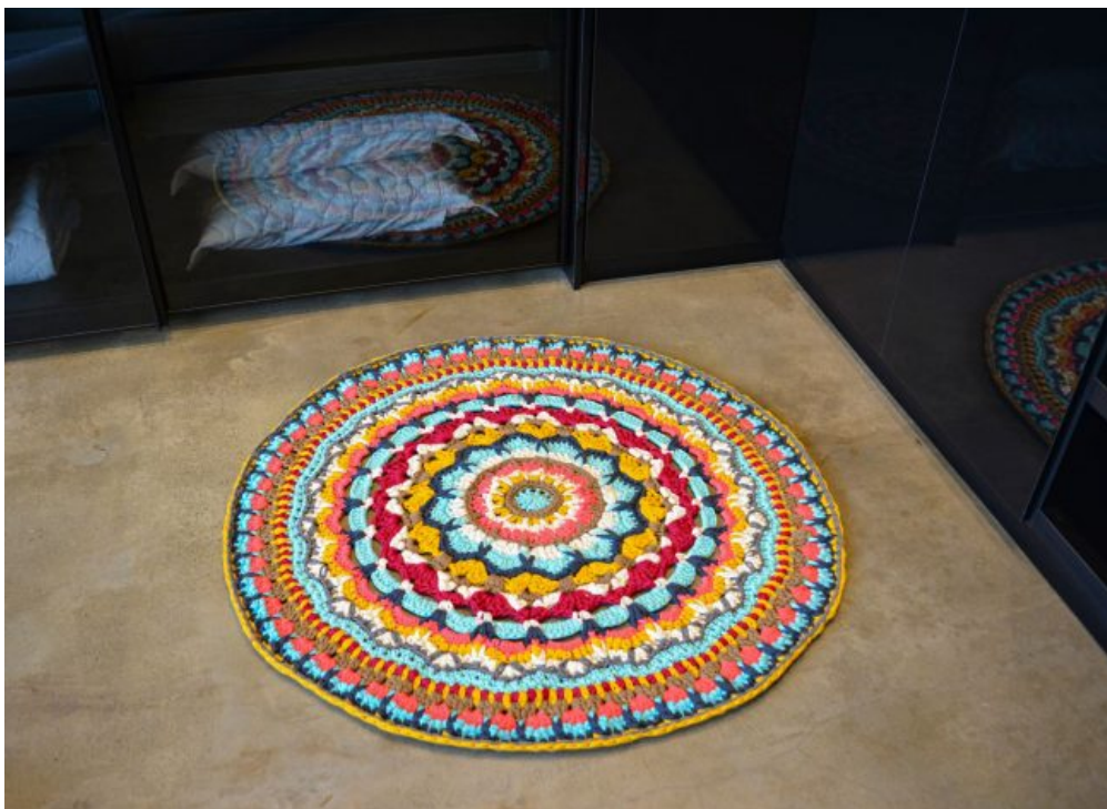
Tapete Redondo Fio De Malha