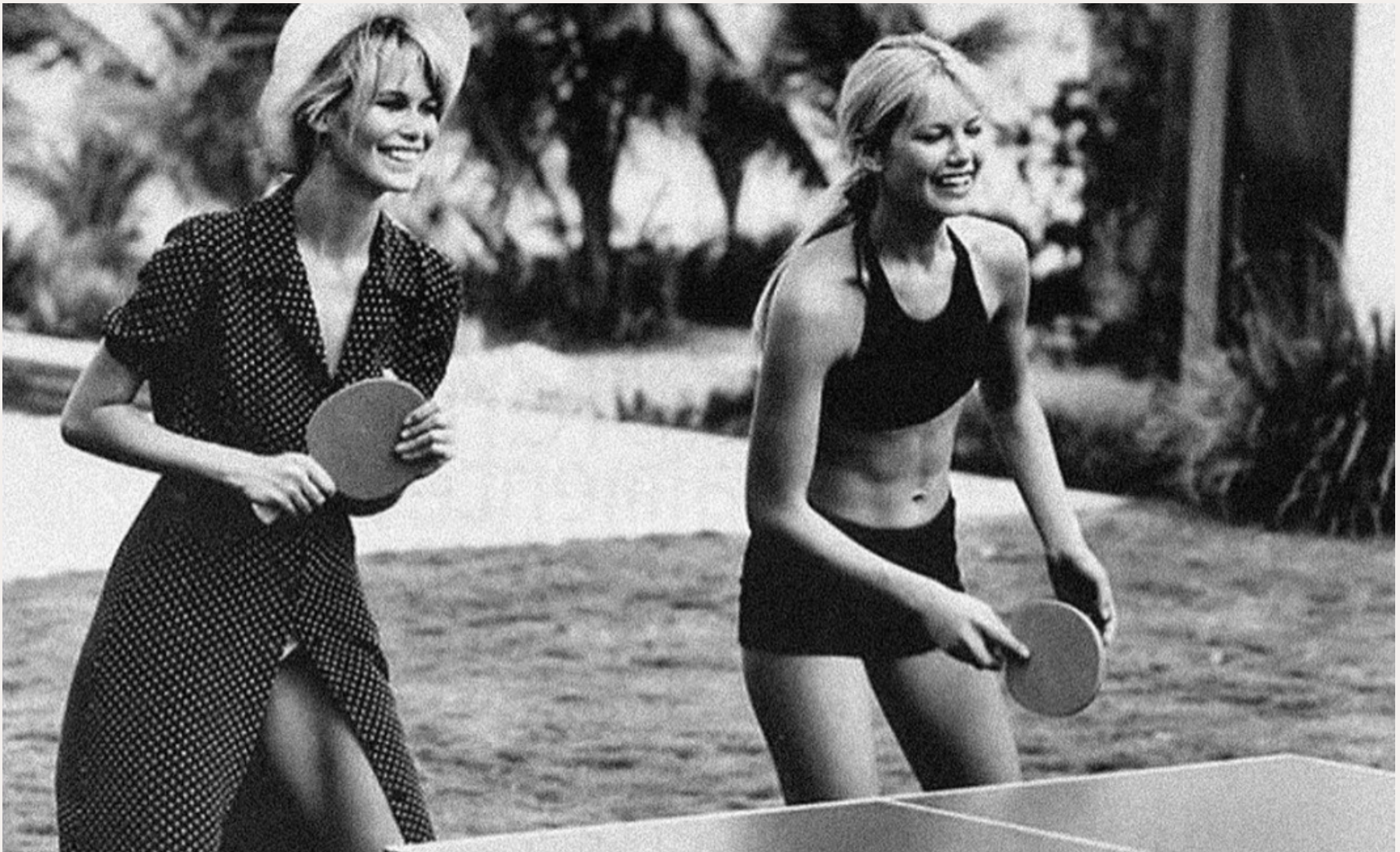
CHANEL 80'S