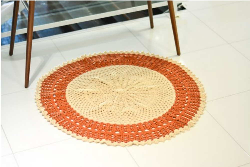
Tapete Redondo Terra