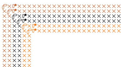
Gráfico 2 - Acabamento

Inicie com 71 corr. + 1 corr. para virar o trabalho.