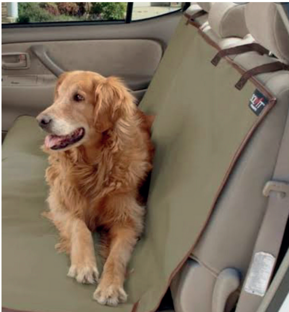
Capa para Veículos