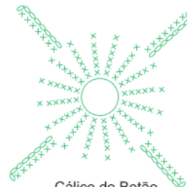
Cálce do Botão