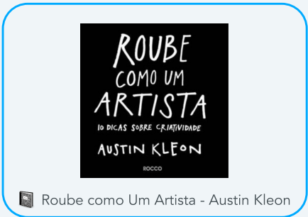
Roube como Um Artista - Austin Kleon