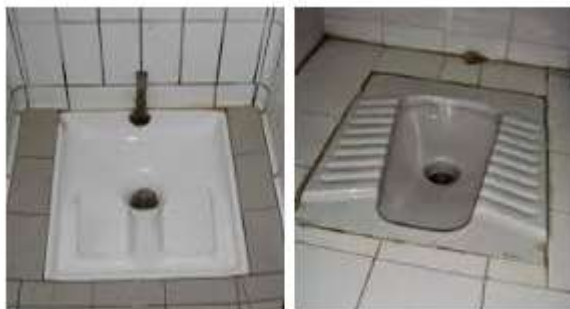
Bacia Turca: não permitida pela NR24