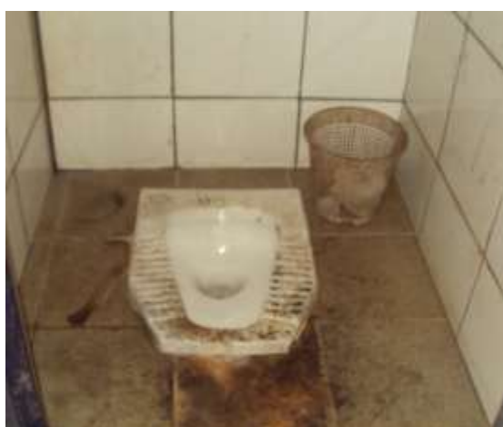
Bacia turca em total desconformidade com a norma, além de condições precaríssimas de higiene

Ressalto, entretanto, que a NR18 em vigor (Portaria MTb n.º 261, de 18 de abril de 2018), como dito anteriormente, norma setorial da construção civil, permite o uso da bacia turca, vejamos item 18.4.2.6.2: