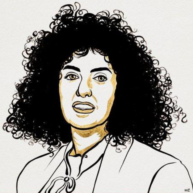
Illustration: Niklas Elmehed