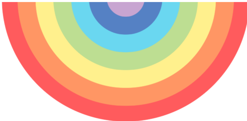
Esquema de Cores