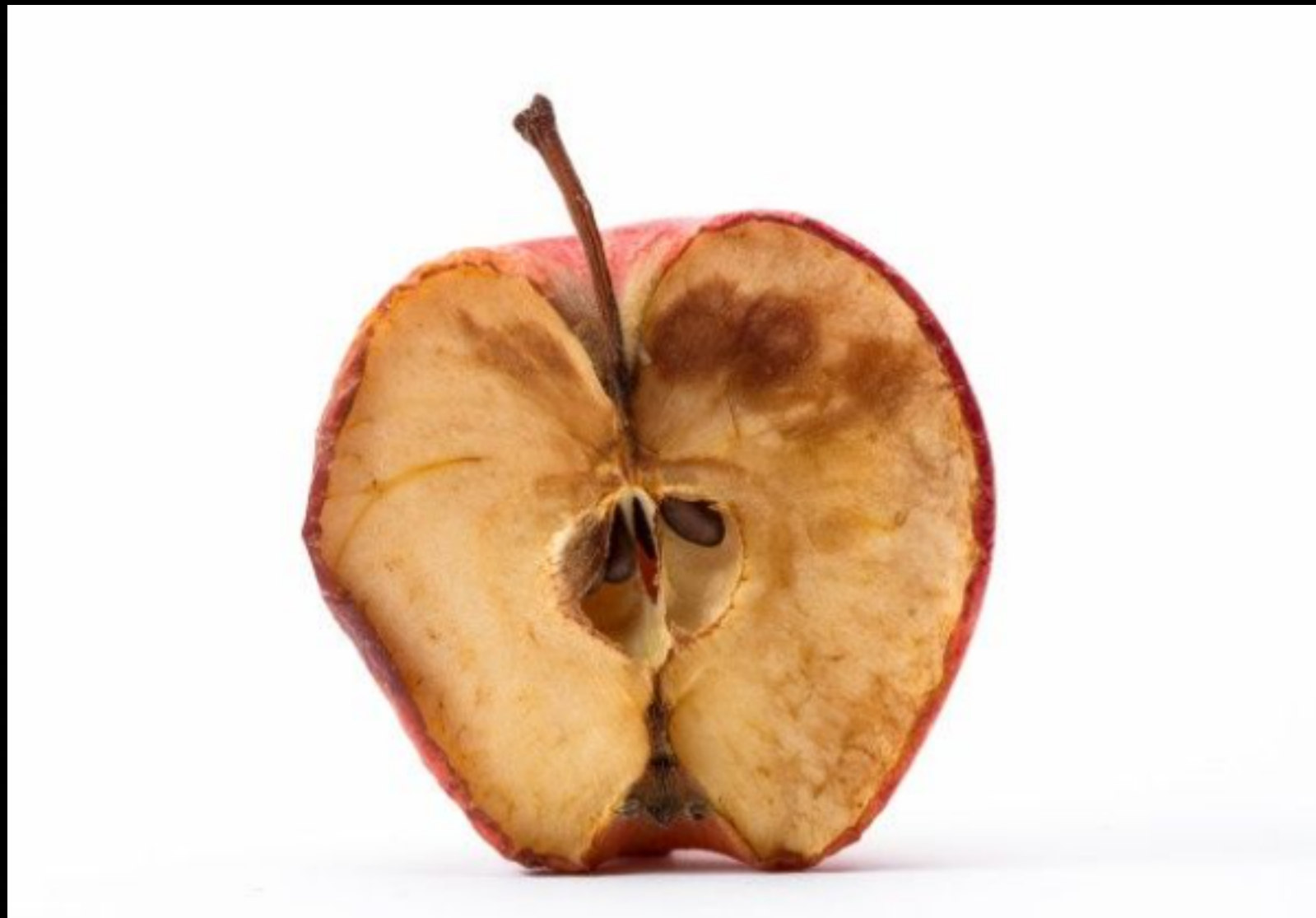
Imagem provoca resposta emocional .