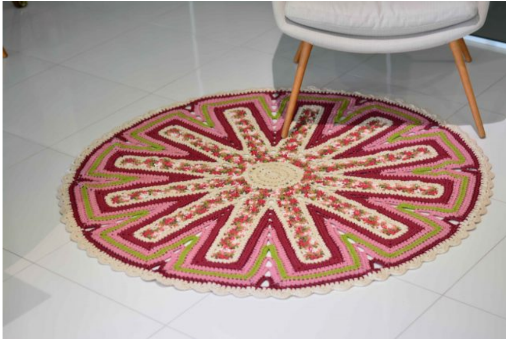
Tapete Redondo Variante