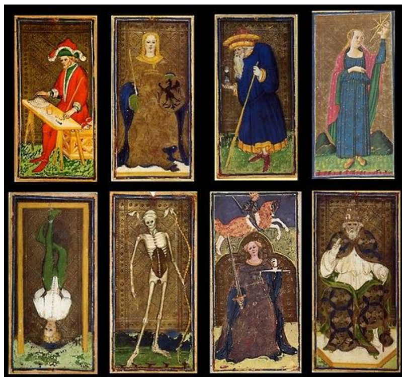
Tarot de Visconti

Com o passar do tempo, cada carta recebeu um nome e um número, e foi estabelecido o padrão de Tarot Clássico (ou Tradicional), cujos símbolos são associados SOMENTE aos conceitos gerais da Tarologia (ou seja, sem nenhuma associação a outro tipo de conhecimento). Mais tempo se passou e muitos autores redesenharam as cartas associando-as a vários outros tipos de conhecimento, como astrologia, numerologia, cabala, mitologia e etc, conhecidos como Tarot Moderno, Tarot Étnico, entre outros.