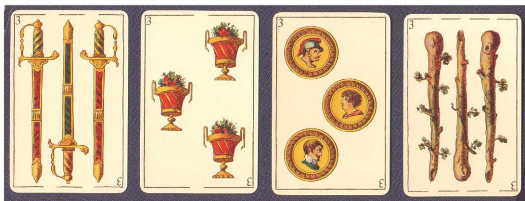
Naipes de Espadas, Copas, Ouros e Paus, respectivamente.

Os Arcanos Menores são divididos em quatro naipes: