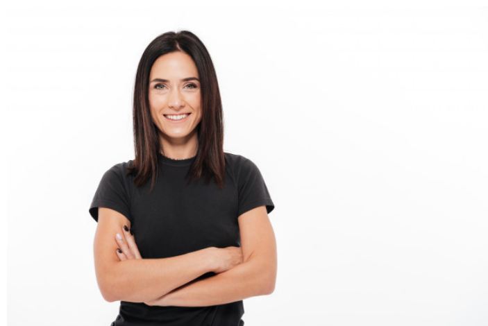
Foto com braços cruzados (sorrindo e séria). Tirar com 3 camisetas diferentes e dois fundos diferentes.