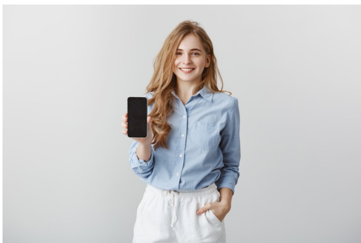
Foto segurando o celular (sorrindo). Tirar com 3 camisetas diferentes e dois fundos diferentes.