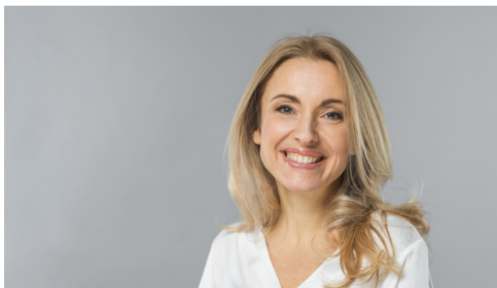
Foto (sorrindo e séria) de frente, do ombro para cima. Tirar com 3 camisetas diferentes e dois fundos diferentes.