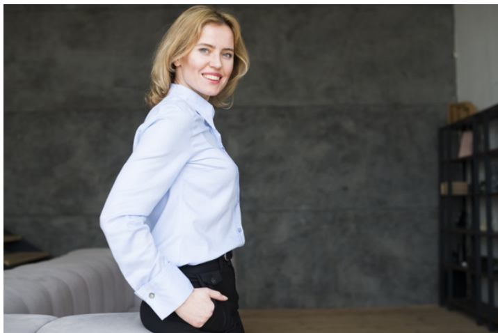
Foto (sorrindo e séria) com a mão no bolso. Tirar com 3 camisetas diferentes e dois fundos diferentes.