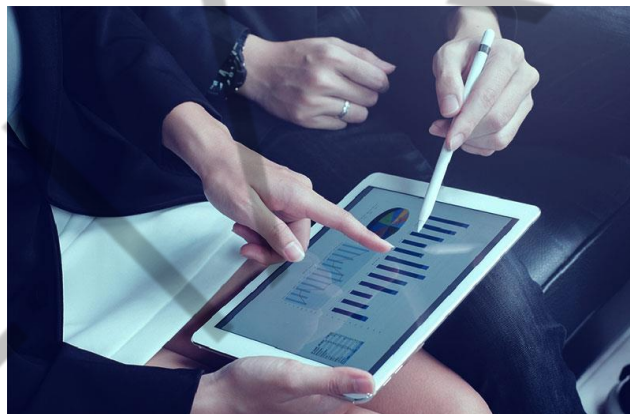
Figura 6.4 - Analogia a administradores de qualidade de dados