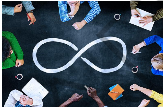
Figura 6.7 - Analogia a loop contínuo

O IBM Agile Information Governance Process consiste em seis etapas e três fases distintas. Na fase Plano ( Plan ), as equipes de governança de dados definem o problema do negócio, obtêm patrocínio executivo, alinham com as equipes e entendem o risco e o valor dos dados. Na fase Ato ( Act ), as organizações implementam um ou mais projetos baseados em casos de uso comum. Finalmente, na fase Avalia ( Assess ), as equipes de governança de dados medem os resultados.