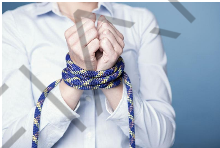
Figura 6.5 - Analogia a burocracia

Quando ouvimos expressões como “processos e procedimentos”, imediatamente pensamos em “burocracia”, pensamos nisso como os inimigos da agilidade.