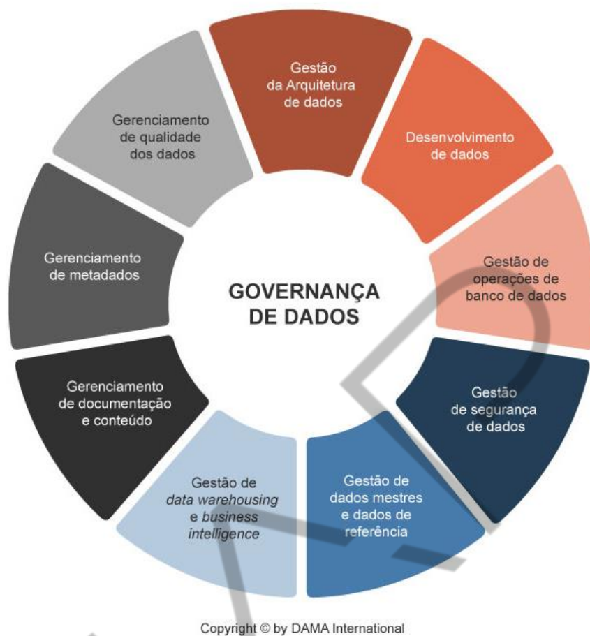
Figura 6.1 – Governança de dados

Abaixo, o conjunto das funções definidas pelo guia DAMA-DMBOK® para Gestão de Dados: