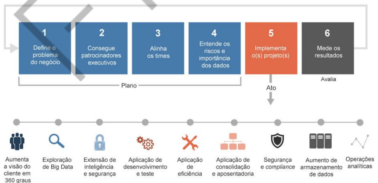
Figura 6.6 – IBM Agile Information Governance Process

A IBM publicou um paper intitulado “ The IBM Agile Information Governance Process (2014) ” para abordar a necessidade de uma metodologia ágil para a governança de dados. Propõe uma abordagem alternativa sobre como entregar as iniciativas de Big Data com projetos-piloto, mas ainda ser capaz de abordar os principais problemas de governança.