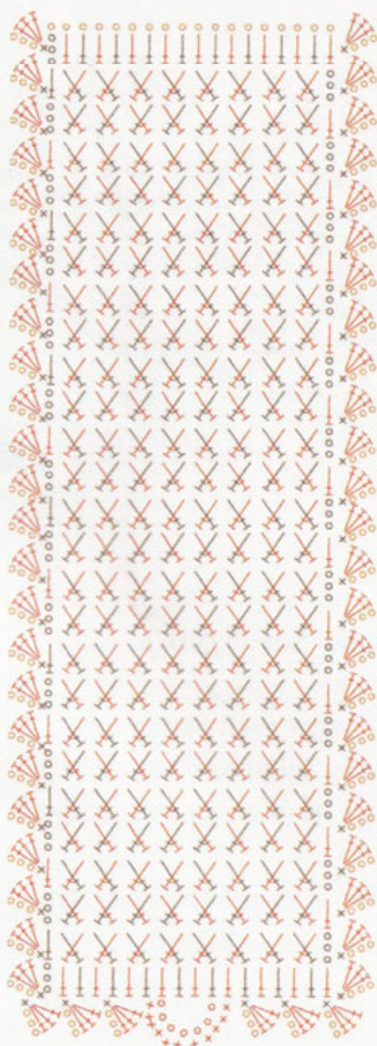
Gráfico 04 - Porta-papel - dobrar na metade