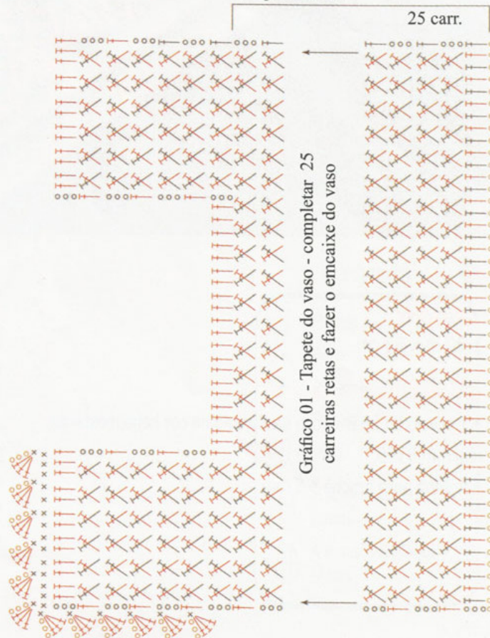
Gráfico 01 - Tapete do vaso - completar 25 carreiras retas e fazer o encaixe do vaso

Gráfico 03 - Encaixe da tampa do vaso - completar 23 carr.