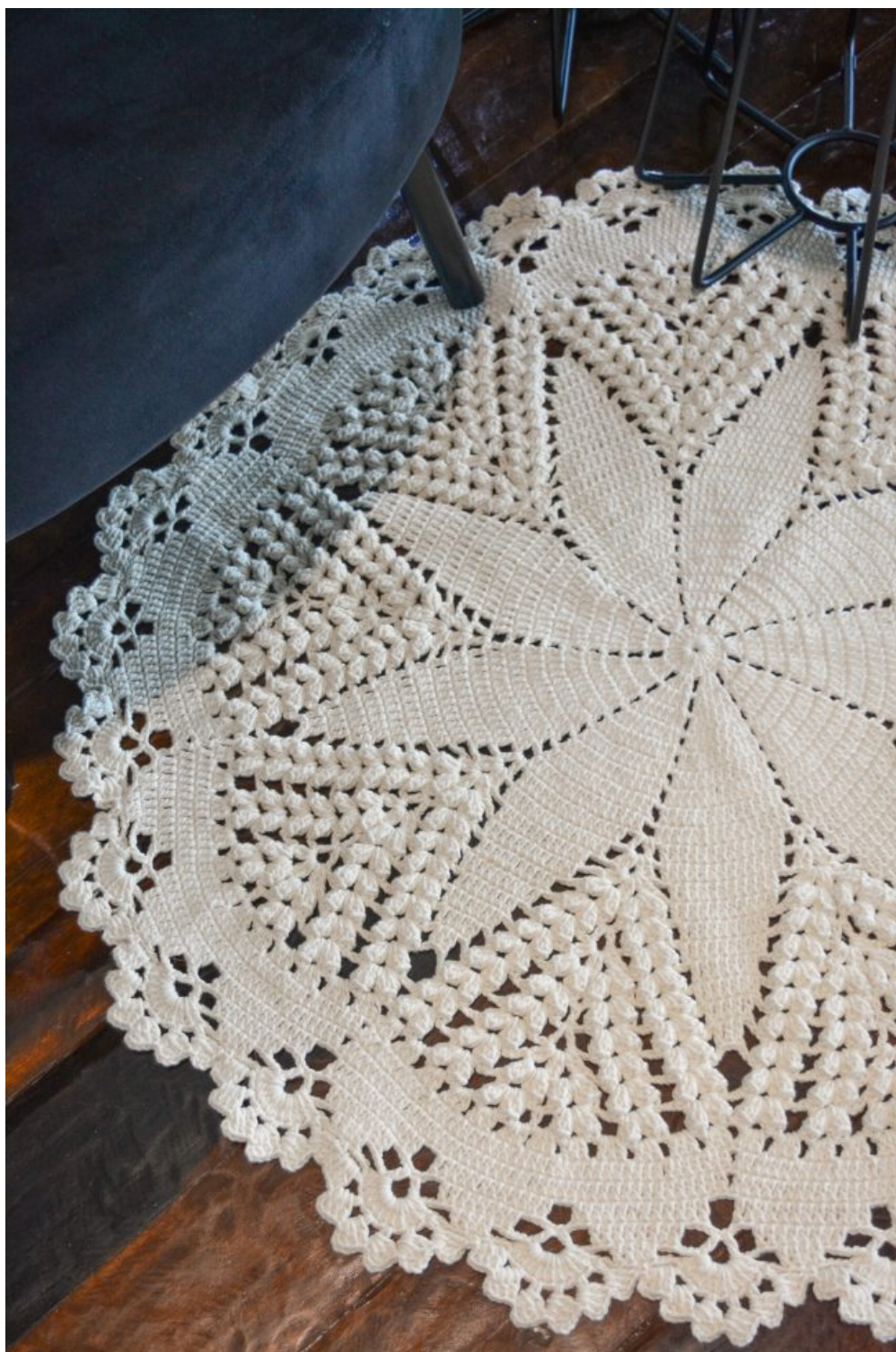
Tapete Redondo Natural