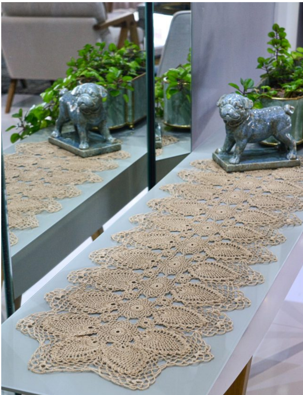
Trilho de Mesa Castanha