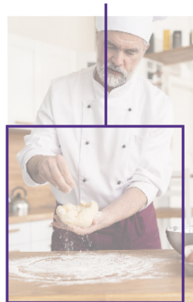
Indicação do frame