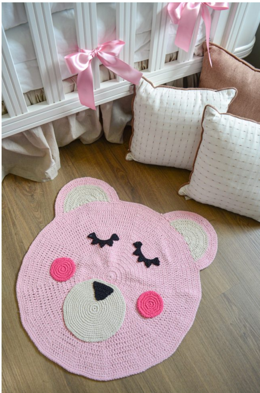
Tapete Urso Rosa Bebê