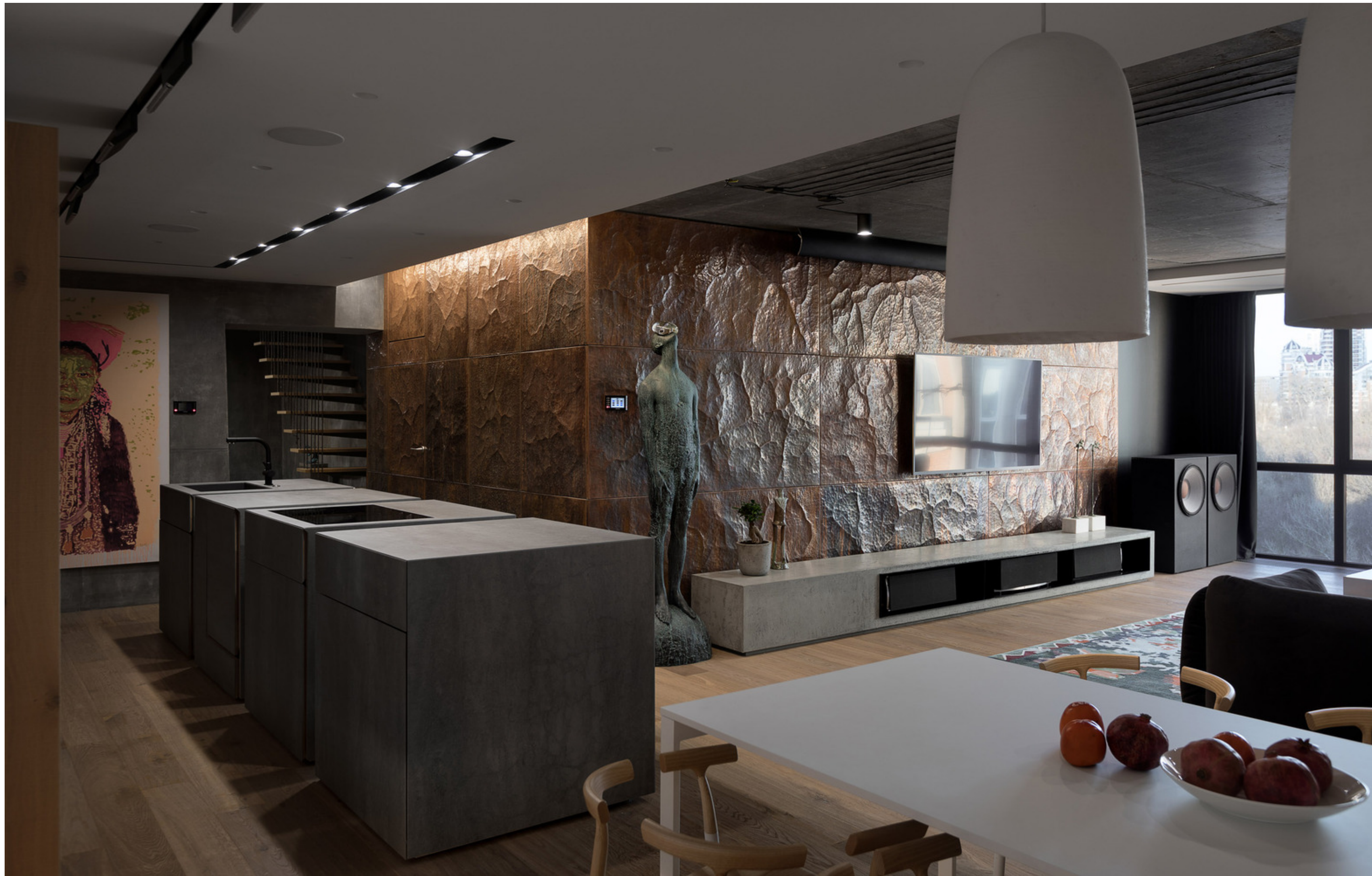
MOD Apartment - projeto Sergey Makhno Architects