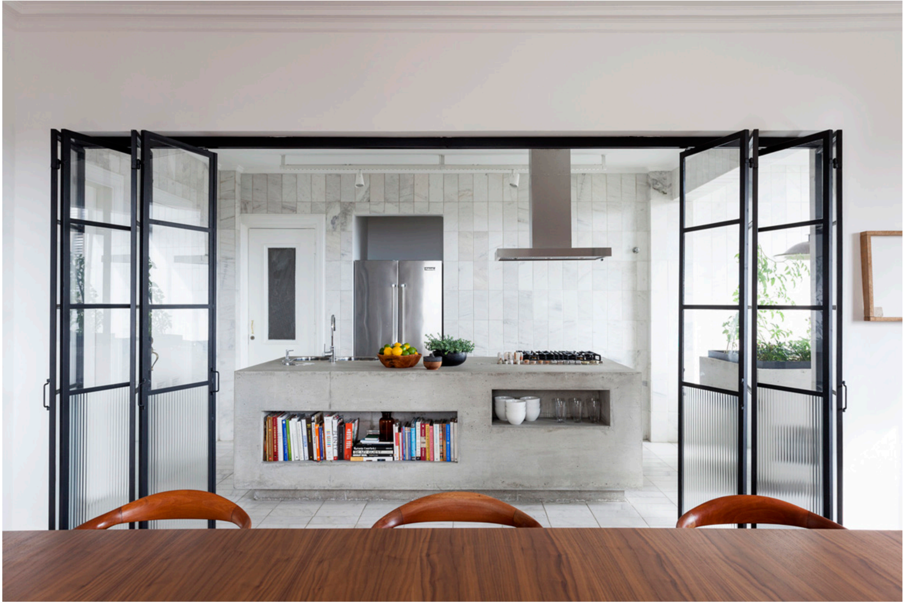
fotografia @franparente - projeto felipe hess