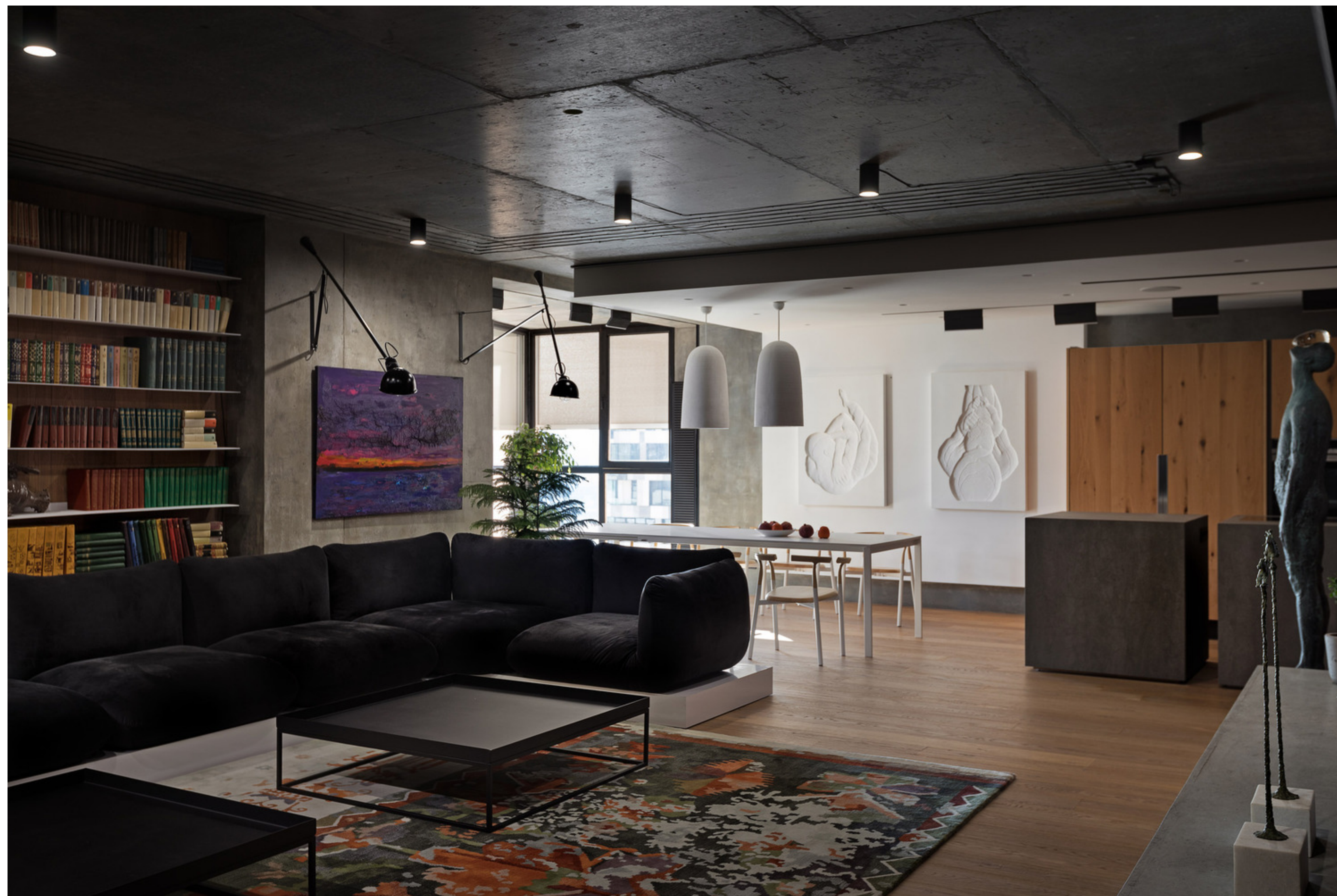
MOD Apartment - projeto Sergey Makhno Architects