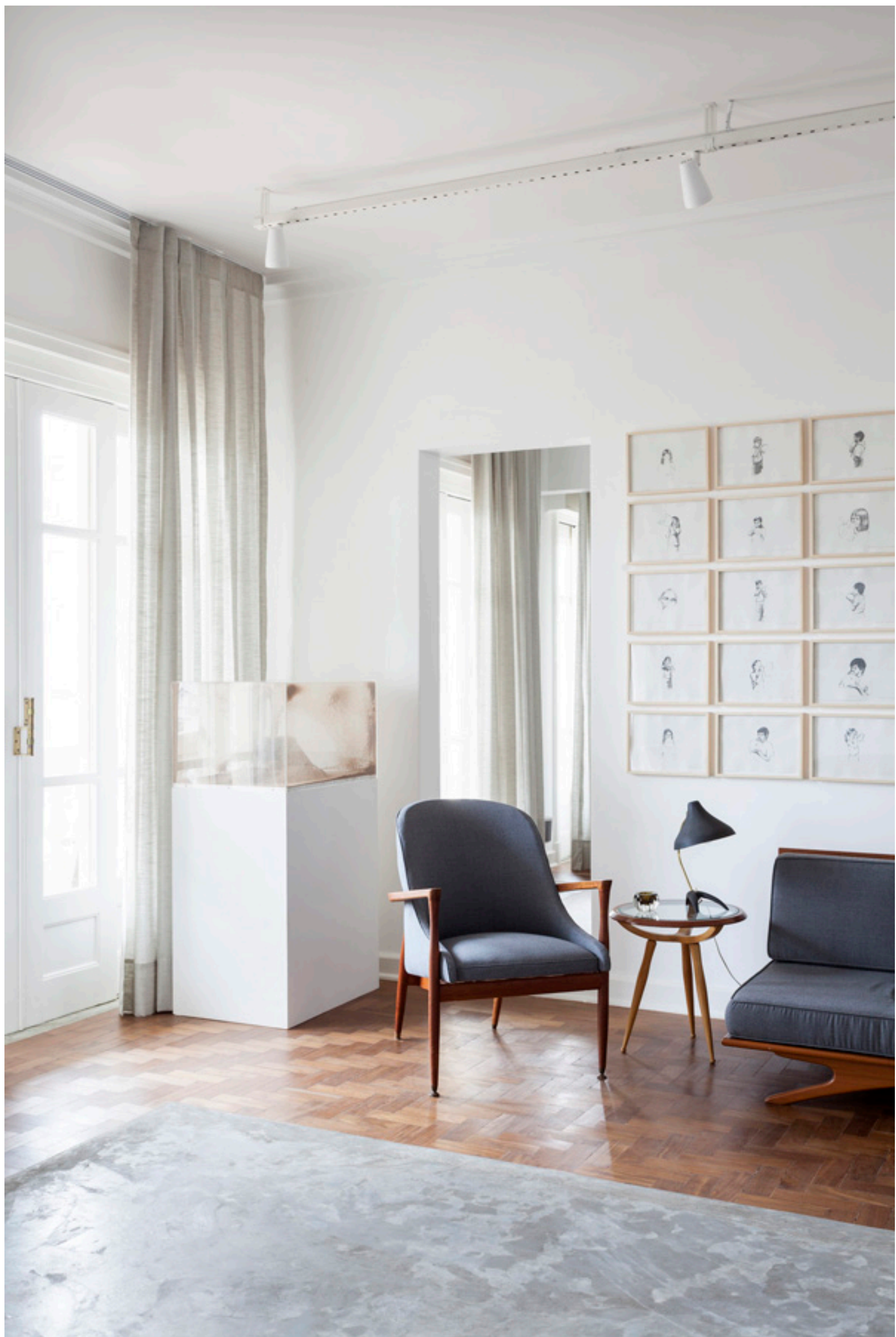
projeto felipe hess