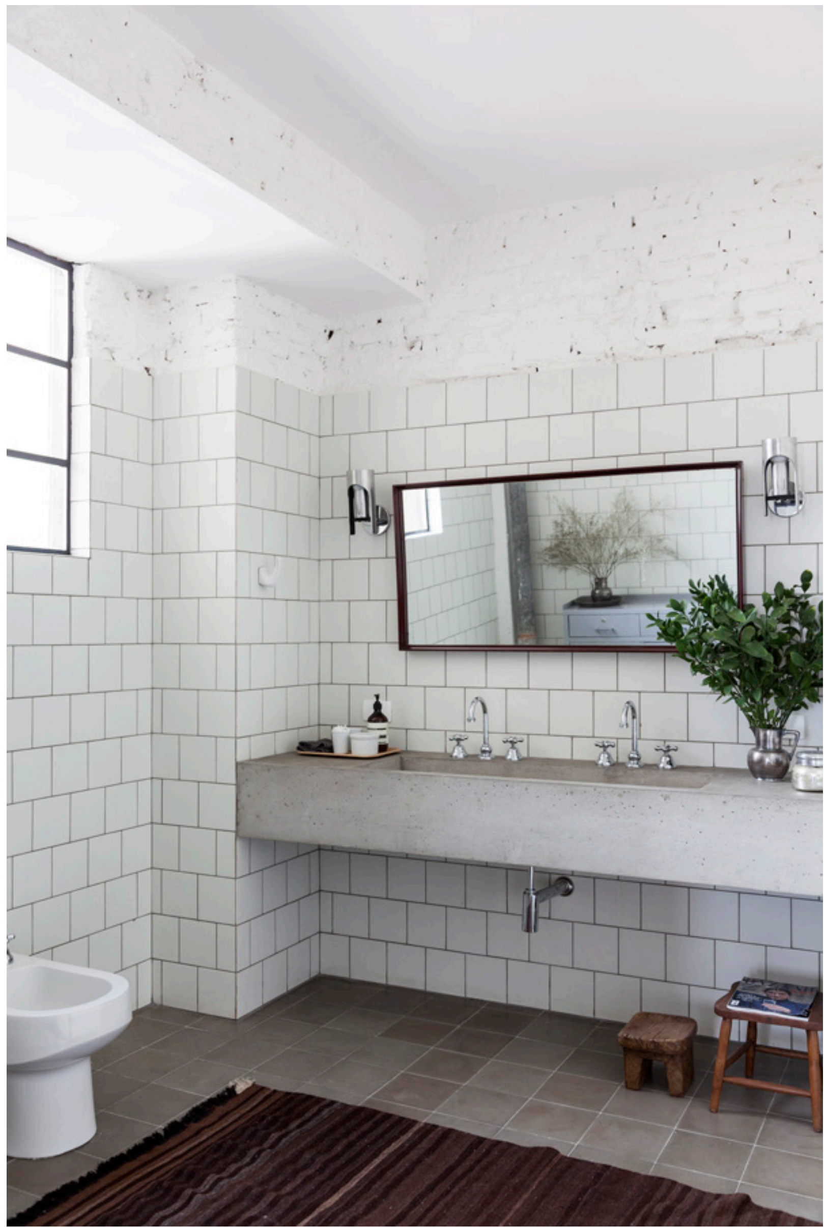
fotografia @franparente - projeto felipe hess