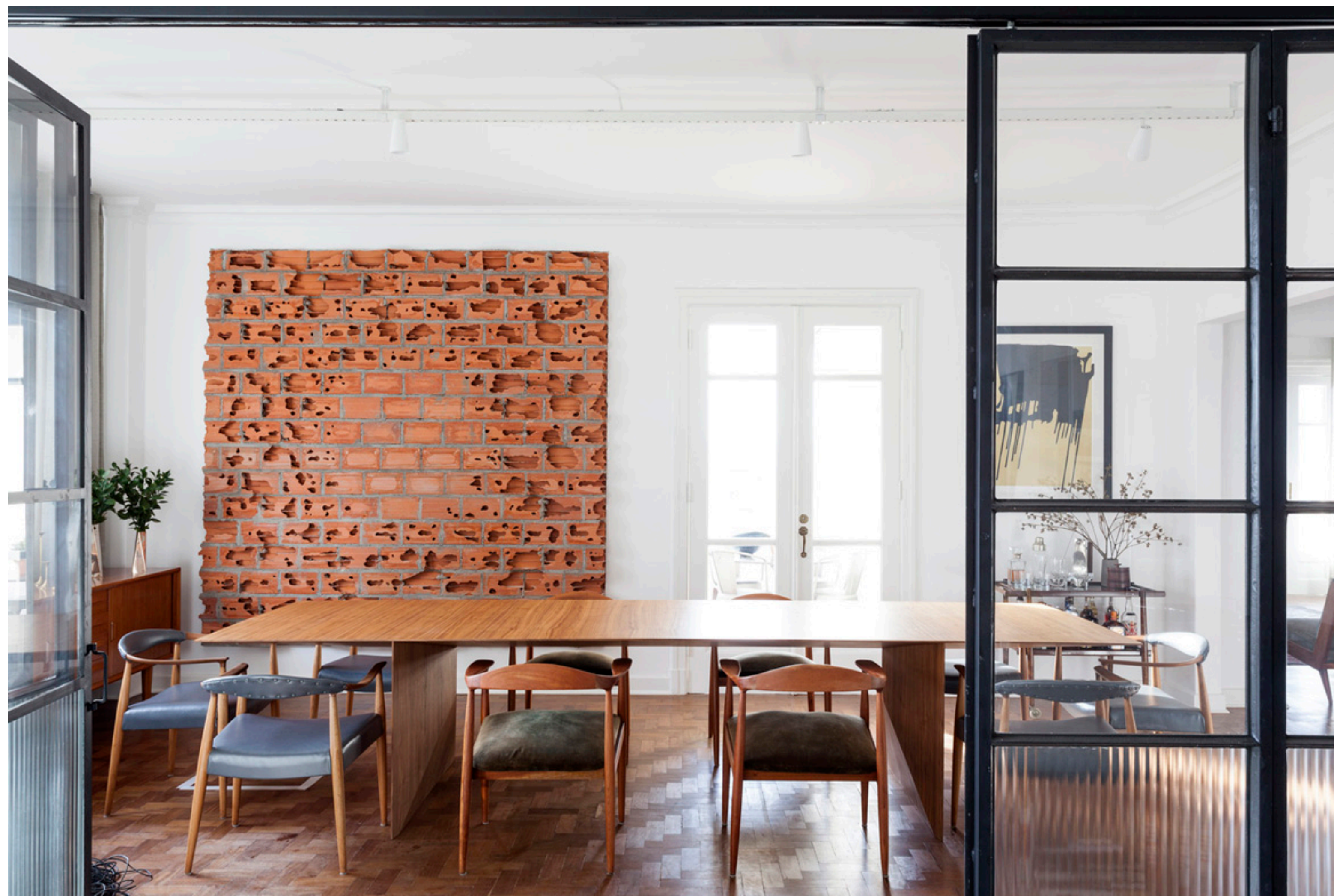
fotografia @franparente - projeto felipe hess