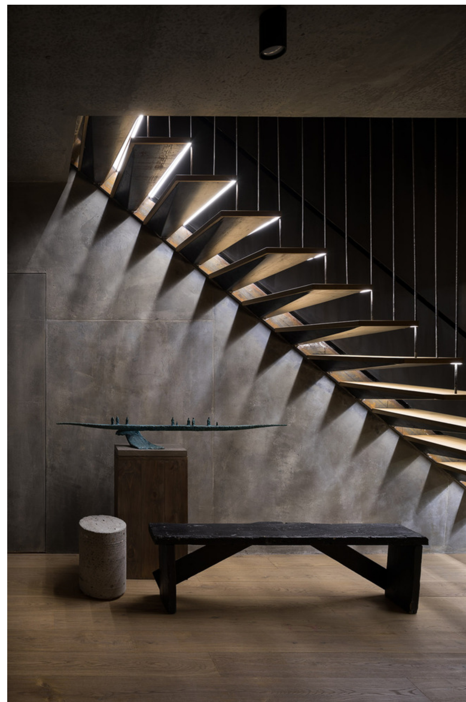
MOD Apartment - projeto Sergey Makhno Architects