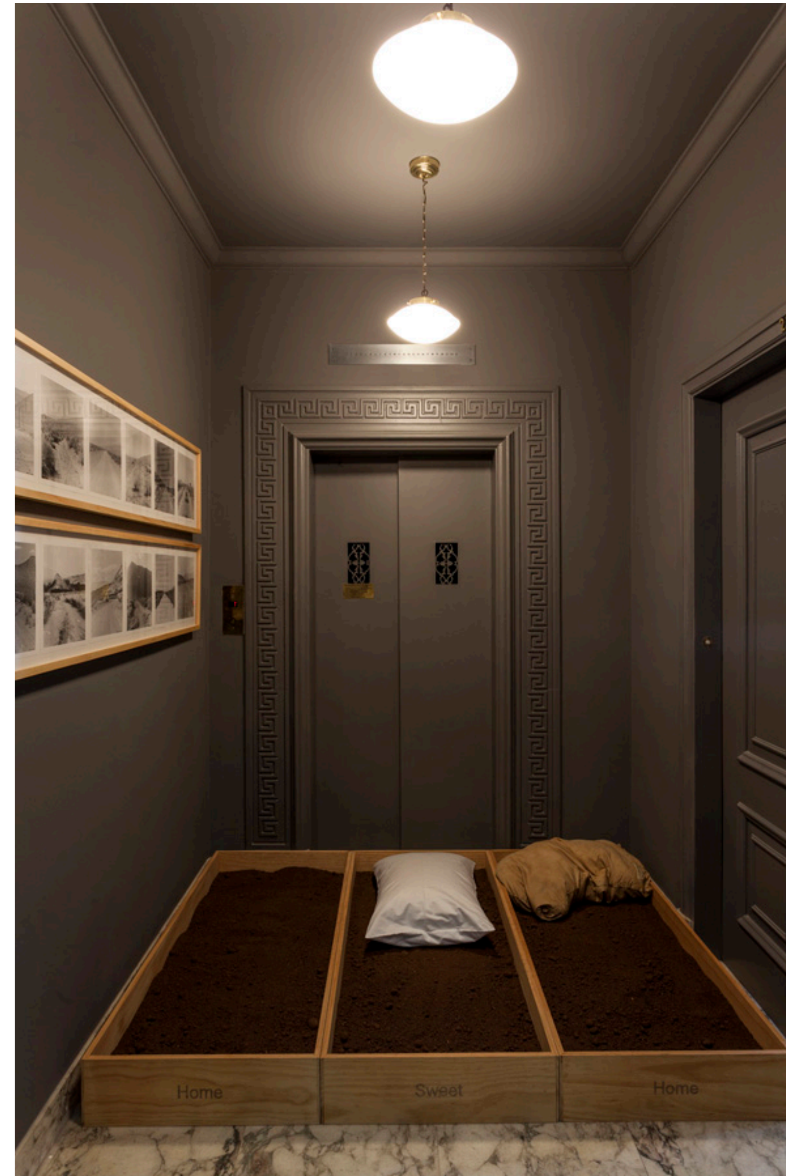
projeto felipe hess

“Em um edifício histórico assinado por Franz Heep, o projeto procurou conciliar a originalidade do apartamento e a coleção de arte dos moradores porém com detalhes que trazem o projeto para o tempo presente.”