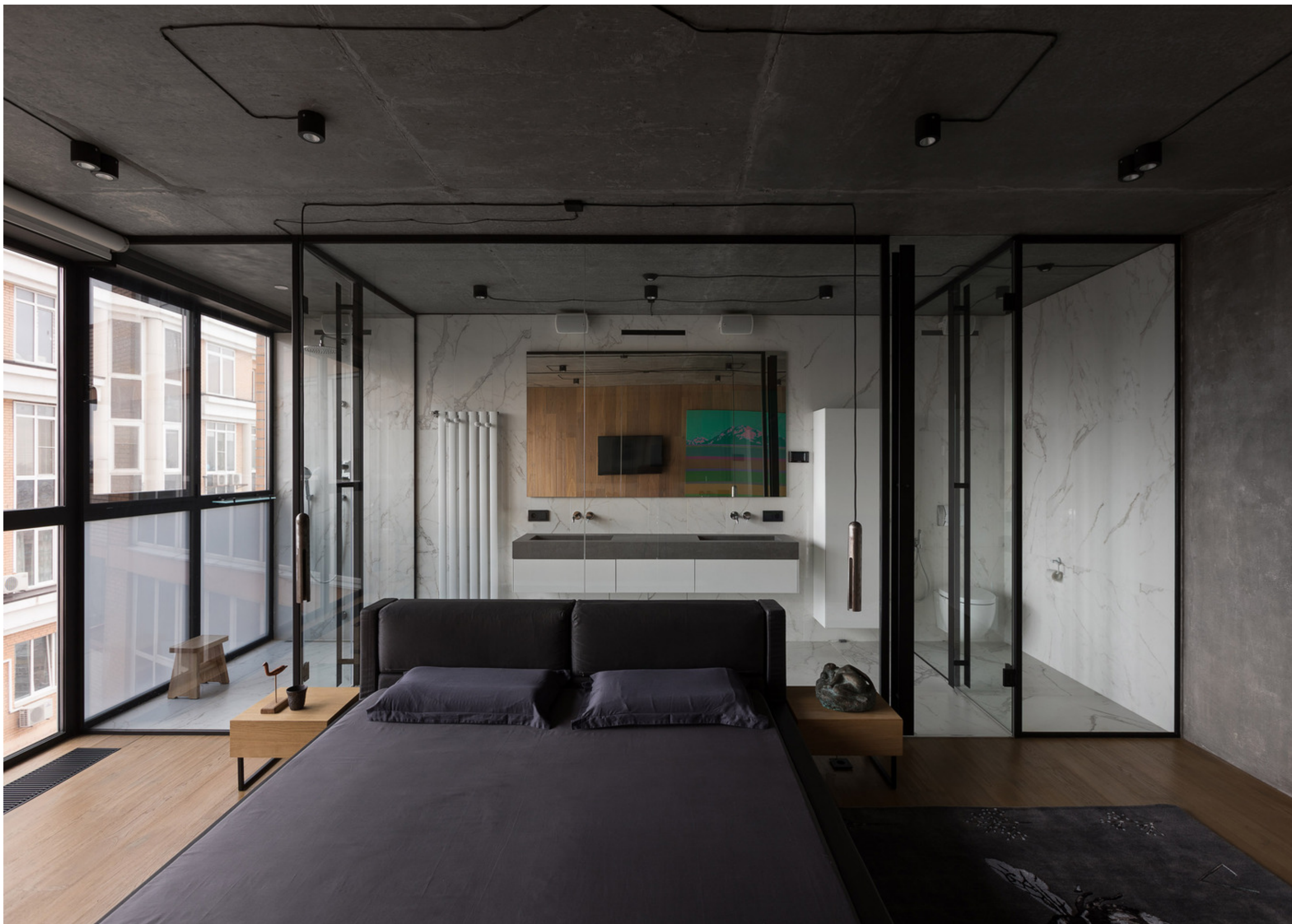
MOD Apartment - projeto Sergey Makhno Architects - fotografia Andrey Avdeenko