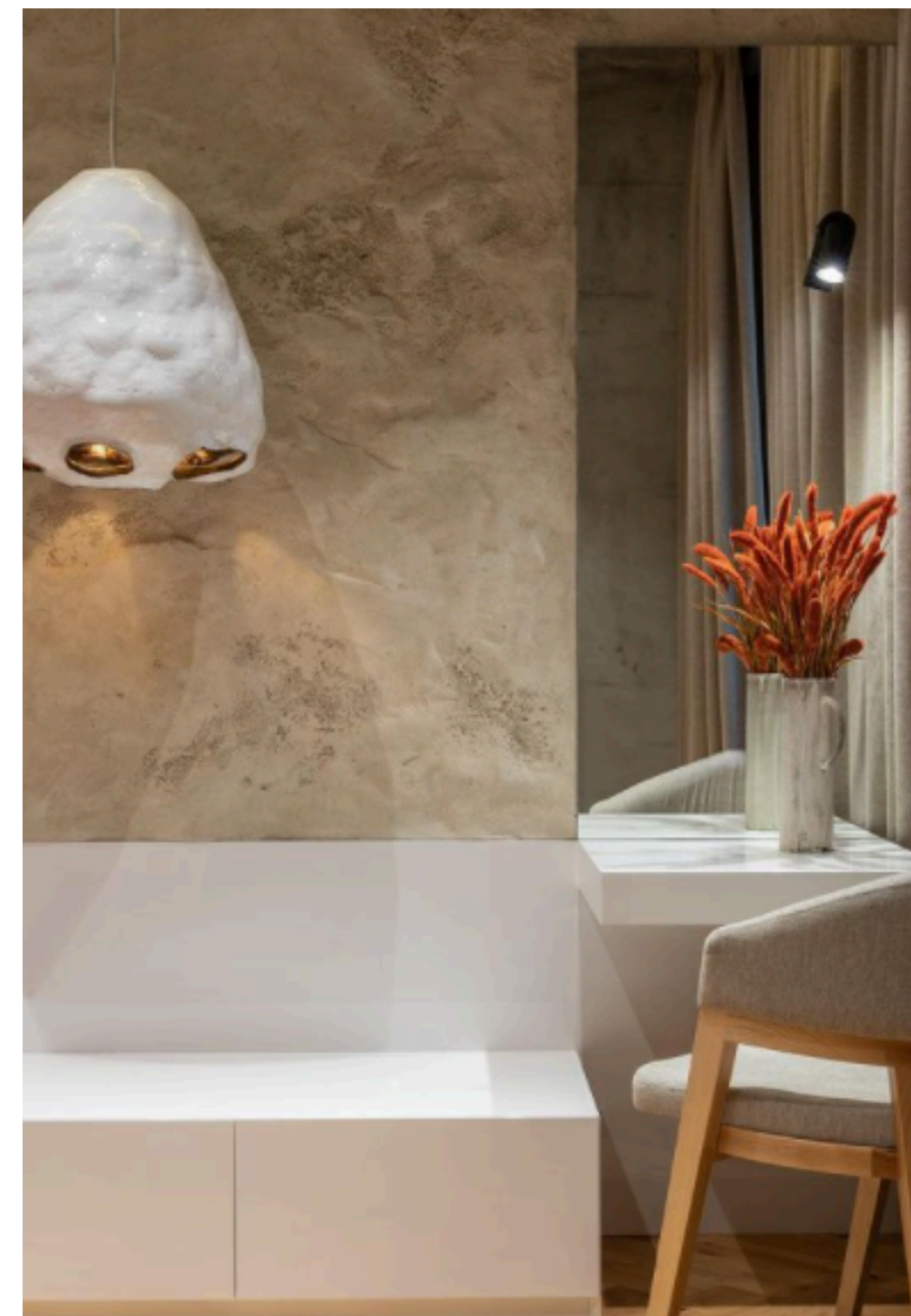
Makanza Apartment, Kyiv, Ukraine - Sergey Makhno Architects