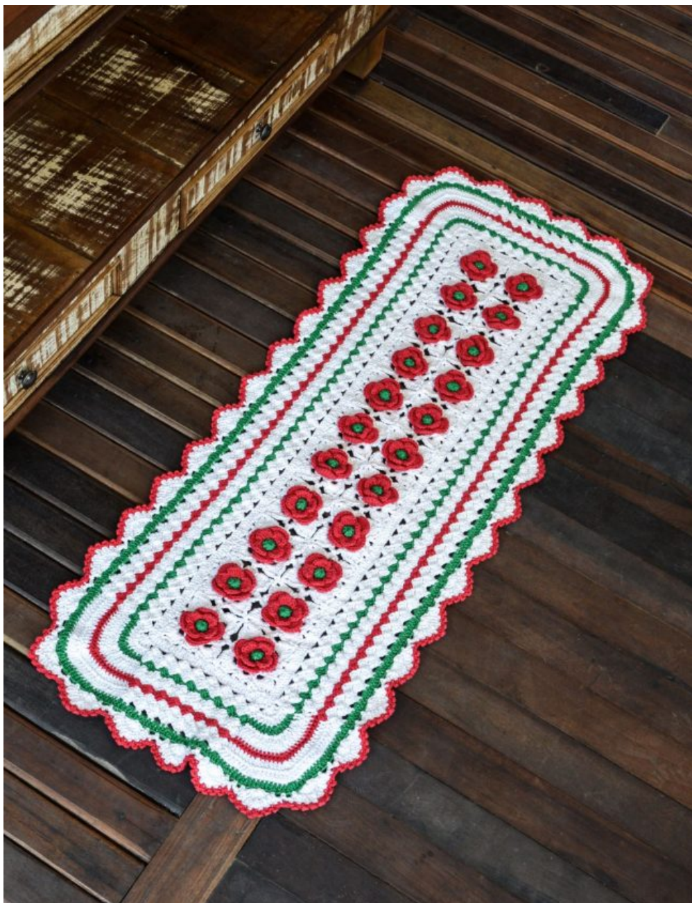
Tapete Natalino com Flores