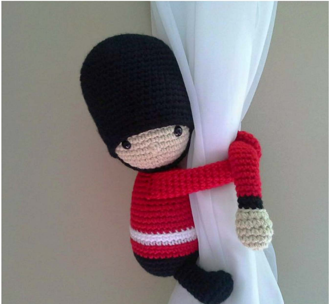
Guarda da Rainha - Prendedor de cortinas