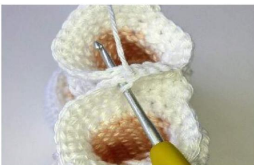
A Fig. 5