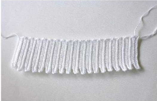
A Fig. 11

Costurar ou cola-lo para a cabeça com um pouco de cola de tecido.