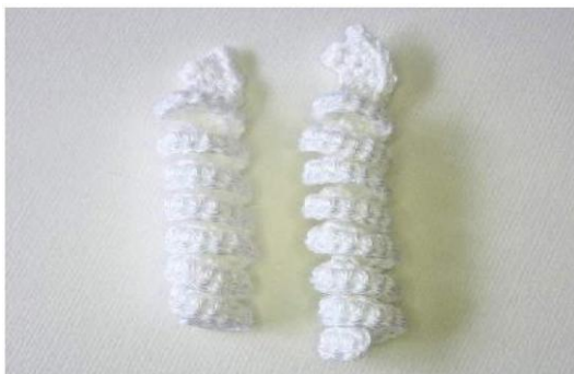
A Fig. 15