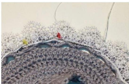
A Fig. 19

Decore sapatos com um laço e uma pérola se desejar. (Fig. 21)