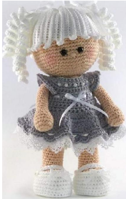
A Fig. 21