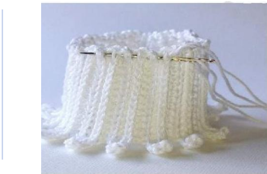
A Fig. 13