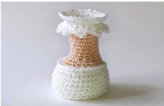
A Fig. 3

Coloque as duas pernas juntas e una com 6 pb no centro. (Fig. 5) Arremate e esconda o fio.