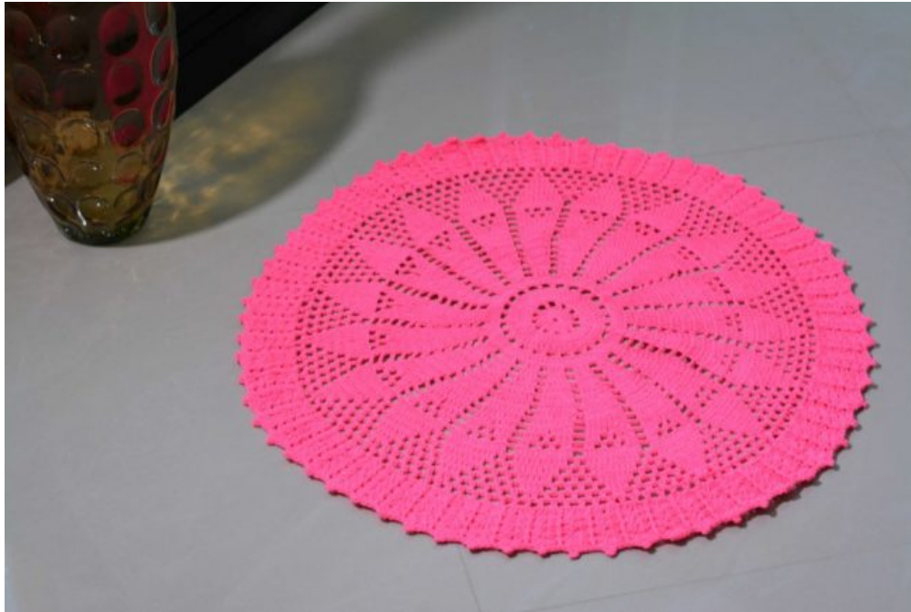
Tapete Apolo Neon Rosa