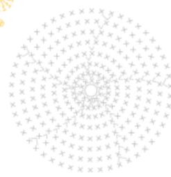
Gráfico 5 - Olho