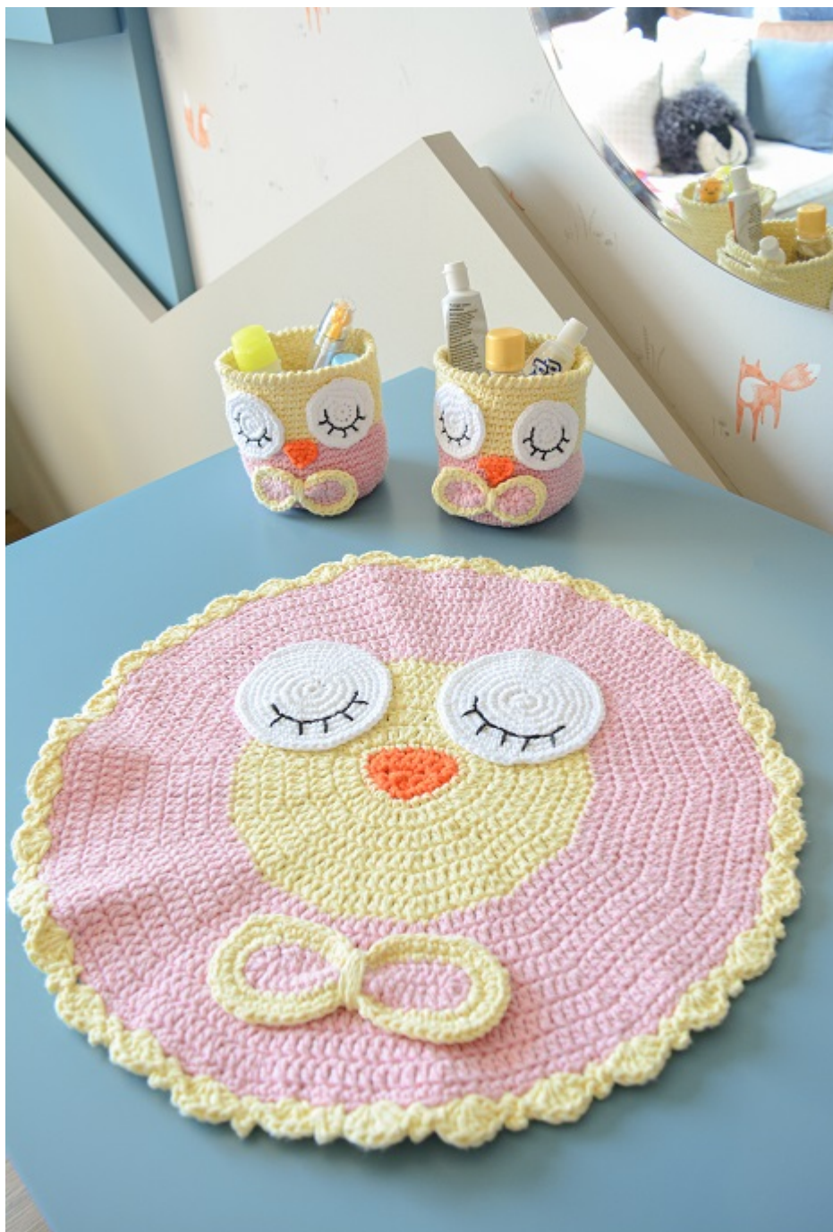
Conjunto Tapete e Cestinhos Corujas Bebê