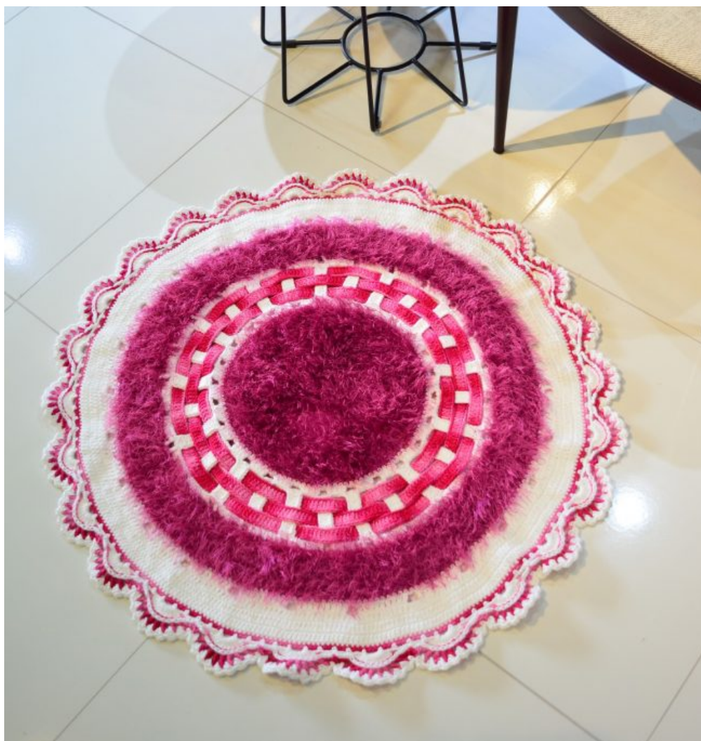
Tapete Tons de Rosa