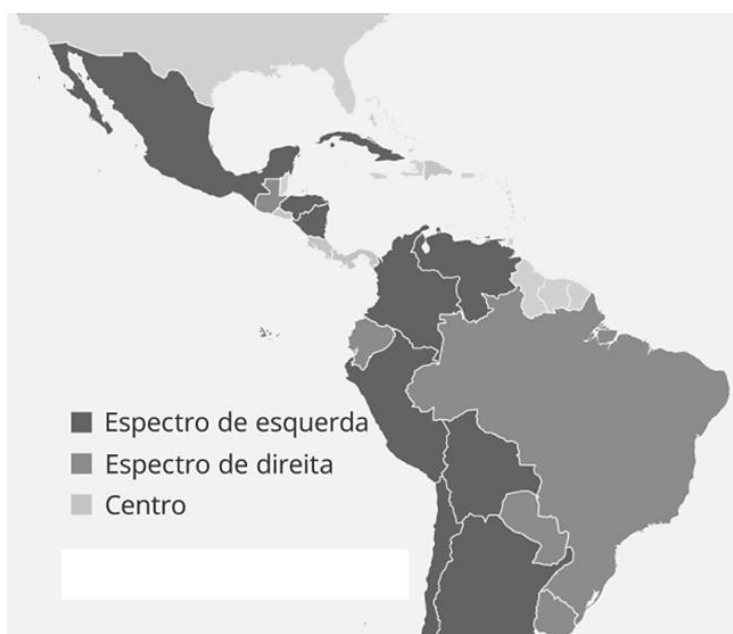
Mapa Político da América Latina

(Dados de 20 de junho de 2022.)