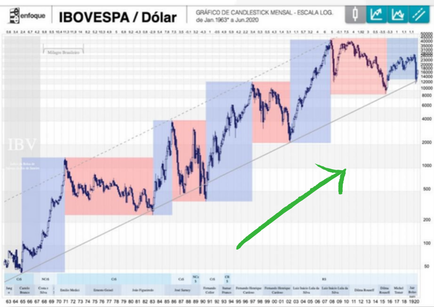
gráfico com evolução da bolsa brasileira mostra que, mesmo com períodos de quedas, a direção da bolsa é sempre para cima.

No curto prazo, você pode perder dinheiro. No longo prazo, essa possibilidade é próxima de zero.