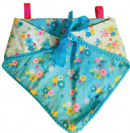
Bandana para Coleira